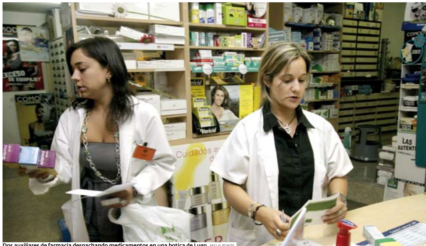
Dos auxiliares de farmacia despachando medicamentos en una botica de Lugo. XESUS PONTE